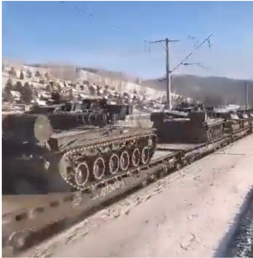
155. Amfibi Piyade Tugayı intikali 16