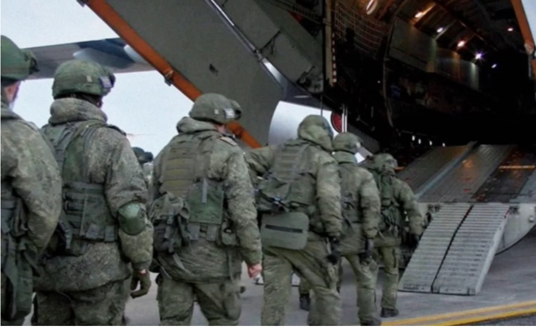
Rus Hava İndirme Birlikleri (VDV) 11

ket etmesi mümkündür. Nitekim, bu raporun kaleme alındığı sırada gözlemlenen gelişmeler 10 , büyük hava indirme birliklerinin olası harekate katılmak üzere intikali hızlandırdığını göstermektedir.