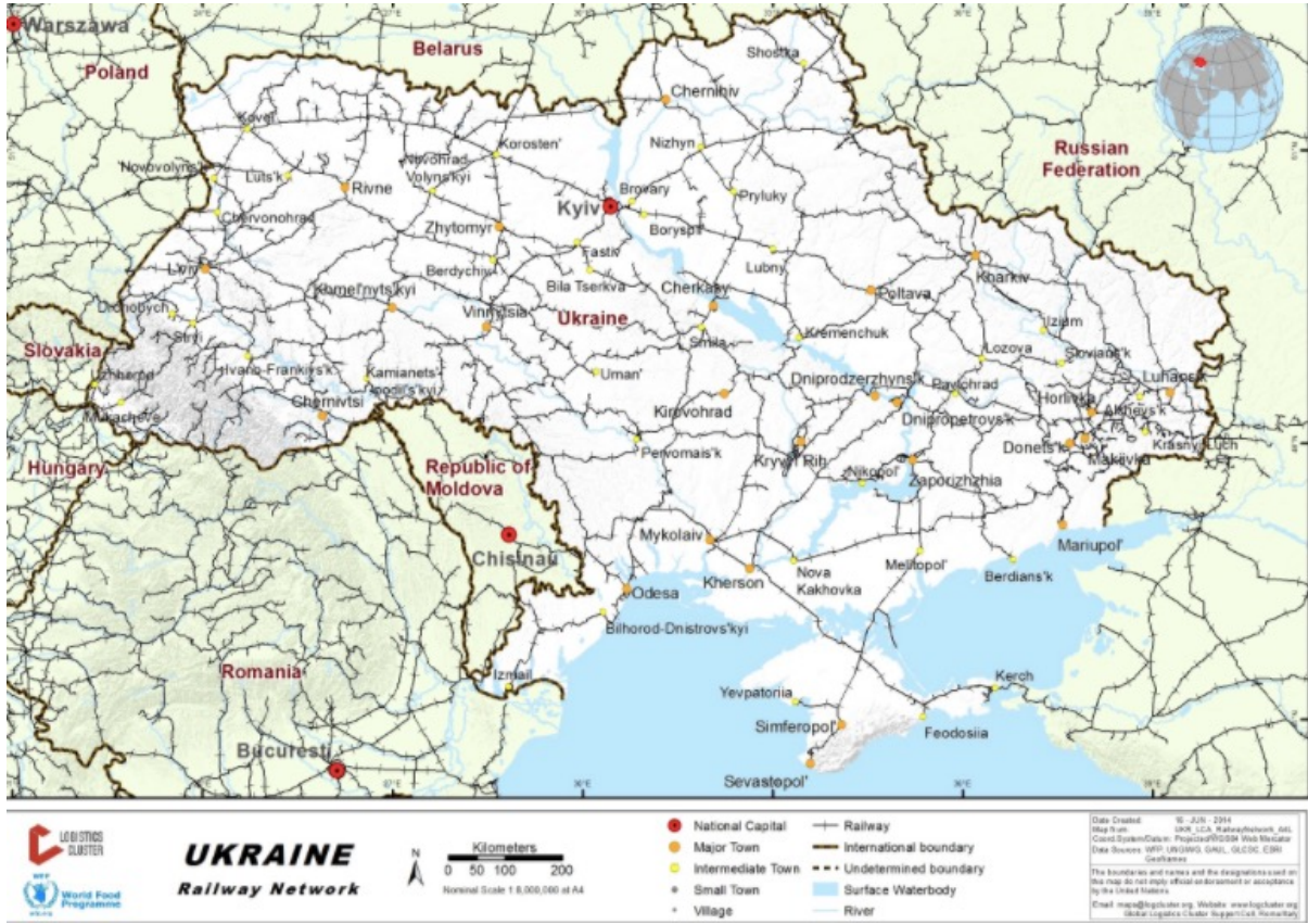
Ukrayna Demiryolu Altyapısı 31

- Ukrayna Silahlı Kuvvetleri, Rus birliklerini taarruzun hemen başında durdurmak gibi gerçekçi olmayan bir hedef yerine, ülke derinliğinde oynak savunma ( mobile defense ) çerçevesinde bir müdafî hareket tasarısını benimser, imkan olduğunda çatışmayı meskun mahale taşır, ayrıca ülke derinliğinde Rus ikmal hatlarını hedef alırsa, durum Şoygu-Ge-rasimov askeri liderliği için içinden çıkılmaz bir hal alabilir.