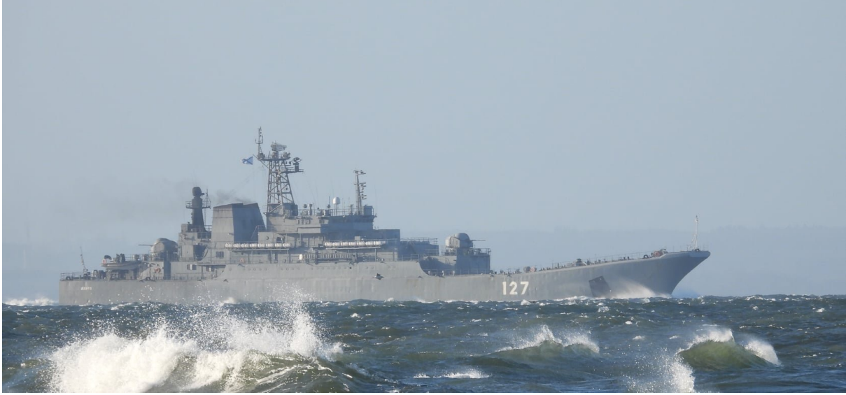
Ropucha sınıfı çıkarma gemileri olası bir amfibi harekatta önemli rol oynayacaktır