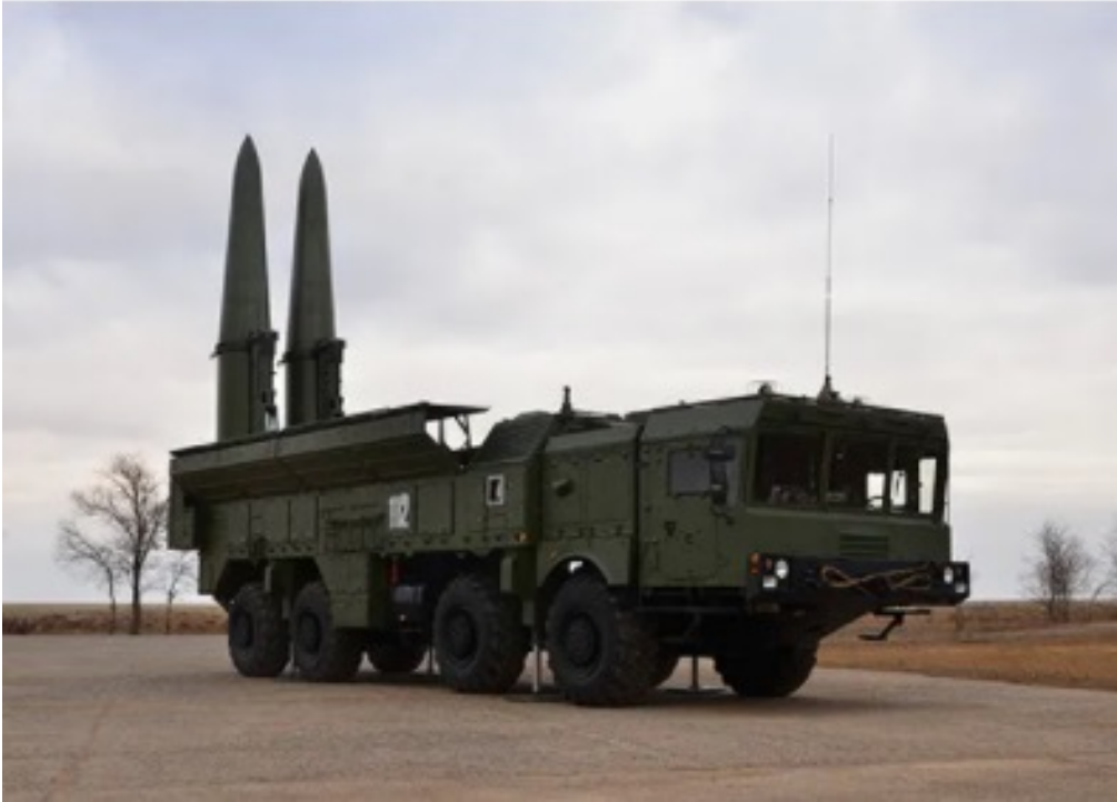
SS-26 Iskender balistik füzesi 19

rayna hava savunma sistemlerinin baskılanması (SEAD görevleri) ve Ukrayna Hava Kuvvetleri'nin yerde tutulması için gerekli hedeflerin vurulmasıdır. Ukrayna hava savunma sistemlerinin baskılanması ya da imha edilmesi, bilhassa, VDV birlikleri cephe gerisine hava indirme görevleri icra edecek ise elzemdir. Bu hususta yapılan değerlendirmeler, Kh-31 ve Kh-58 gibi anti-radyasyon füzeleri, Krasukha-4 gibi elektronik harp sistemleri ile SS-26 Iskender-M balistik füzeleri gibi silah sistemlerinin kullanılabilirliğini kıymetlendirmektedir 18 .